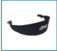
Rückengurt für Rollatoren